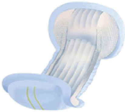
Protection Delta-San Ref: 308851